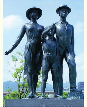
2001年4月28日、神戸メリケンパークに完成した移民船乗船記念碑