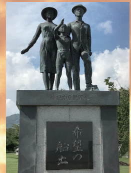
神戸港移民船乗船記念碑