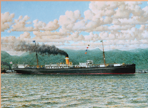
神戸港を出航する第一回移民船「笠戸丸」

【日伯とは】日本とブラジルを意味します。ブラジルは漢字で「 ブラジル 伯刺西爾」、略称では「 日伯 伯国」と表記します。