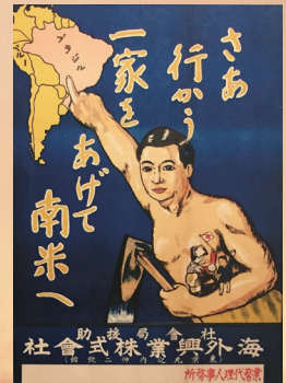
移住奨励のポスター