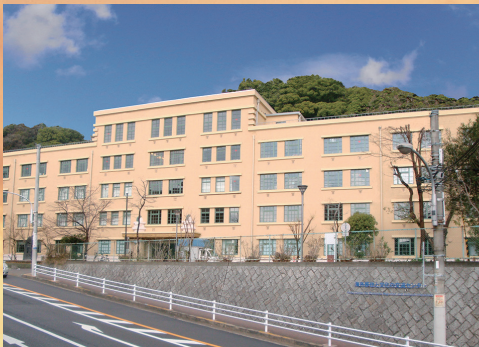
2009年に「海外移住と文化の交流センター」としてリニューアルオープン