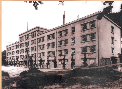
1928年に竣工した国立移民収容所